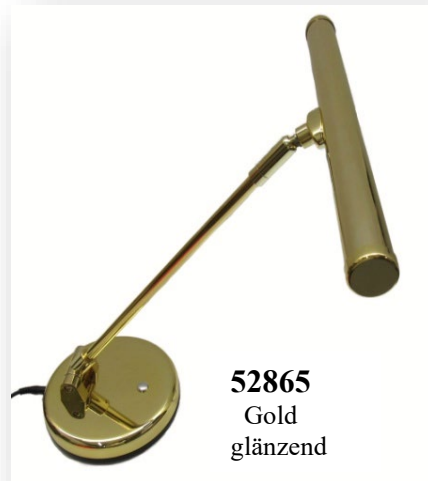
52865 Gold glänzend