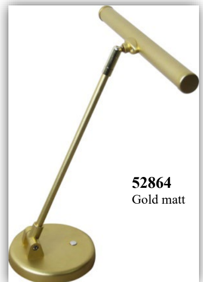
52864 Gold matt

52861 = Schwarz matt 52863 = Silber matt 52864 = Gold matt 52865 = Gold glänzend