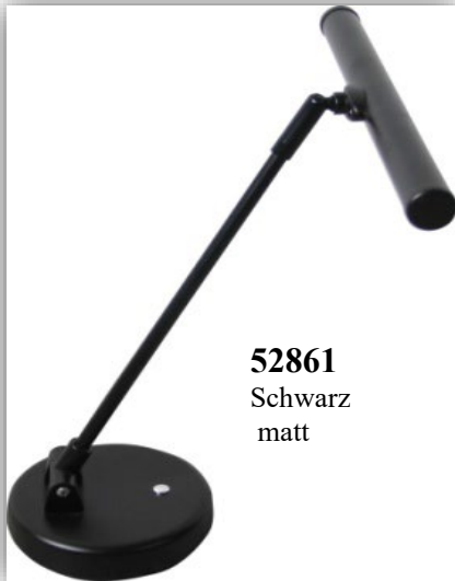
52861 Schwarz matt