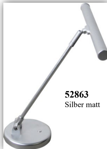
52863 Silber matt